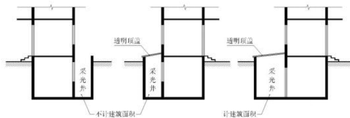
图2 地下室采光井面积计算图示

7.4.3.2 与室内不连通的有透明结构顶盖的地下室采光井及露天的地下室采光井不计算计容建筑面积,见图2。